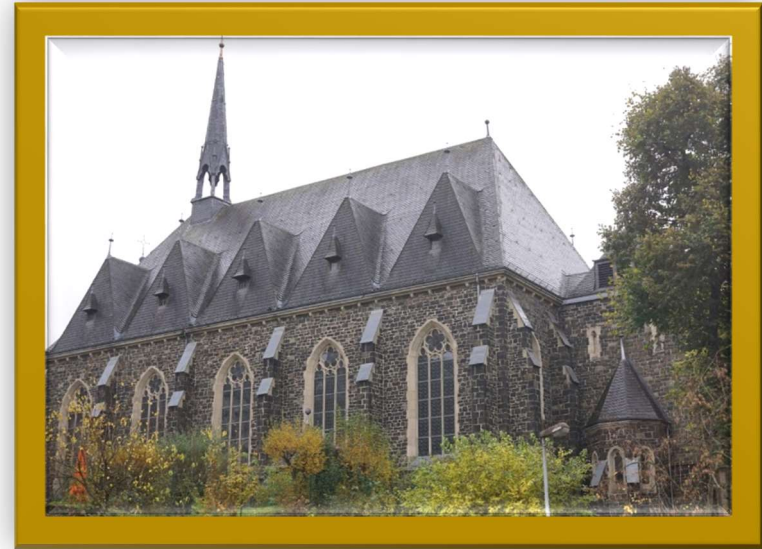
St. Matthäus, Altena

Eine erstaunliche Geschichte aus der Bibel (Lukas 15) – nachgebaut von den Erstkommunikationskindern (Gruppe 1) am 18.11.2023 in Altena.